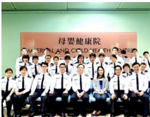
衛生署醫生、西貢區各長官及隊員在母嬰健康院合照留念。