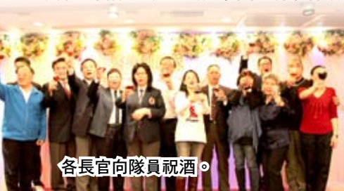
各長官向隊員祝酒。