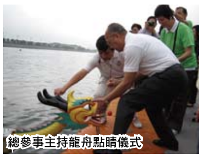
總參事主持龍舟點睛儀式