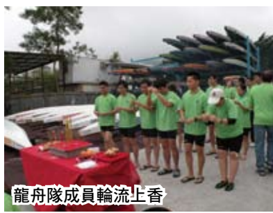
龍舟隊成員輪流上香