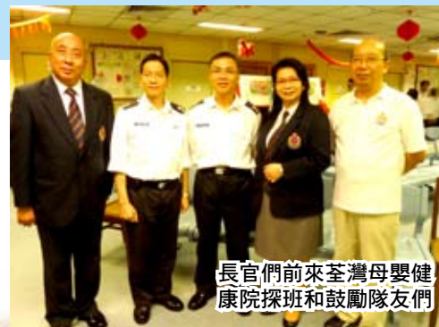
長官們前來荃灣母嬰健康院探班和鼓勵隊友們