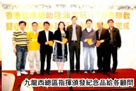
九龍西總區指揮頒發紀念品給各顧問