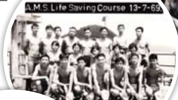
1969年梁Sir參加拯溺訓練班