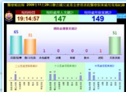
電子颱風／緊急事故值勤隊員記錄