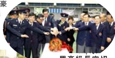
眾高級長官切金豬慶賀

回想今年三月七日，正是深水埗區的新春團拜檢閱操。那天還算天公造美，在正式檢閱的一刻，只是灑著毛毛細雨。師兄、師姐們個個都精神奕奕地站在操場上，伴著微風，迎著細雨，令我深深體會到大家在這次新春團拜檢閱操，真的下了不少功夫，也流了不少汗水。還要感謝當天四處奔走的記者們，因為他們憑著敏銳觸覺把每一刻的精彩場面捕捉下來。最令我難忘的莫過於當晚在豪華酒樓舉行的晚宴，當中擔任司儀的那兩位「爆炸」猛男。他們一身的裝扮及鬼馬搞笑的對話，使大家盡情渡過歡樂的一晚！