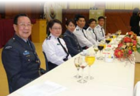
主家席...我們開餐啦!!!!