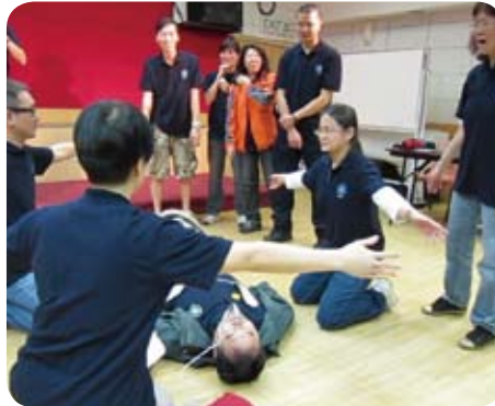
急救情境模擬演繹

翌日上午，進行了分組的團隊遊戲，還得到各長官、高級長官及顧問的參與，隊員們也不敢鬆懈去迎戰。遊戲看似簡單（“放飛機”、“抬轎”、“機械人”及“踩波”），但要贏嗎？也要有策略、技巧及高度的合作性！