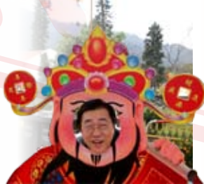
陳總扮鬼扮馬，十分可愛