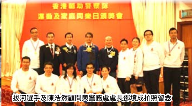
拔河選手及陳浩然顧問與警務處處長鄧境成拍照留念