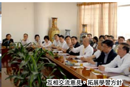
互相交流意見，拓展學習方針