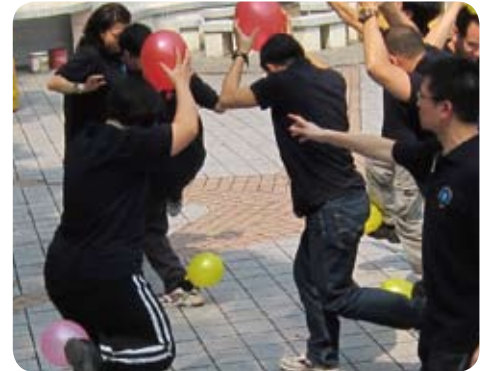
看似簡單的團隊遊戲