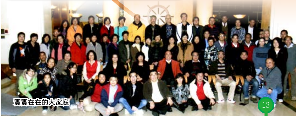
實實在在的大家庭