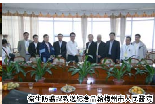
衛生防護課致送紀念品給梅州市人民醫院