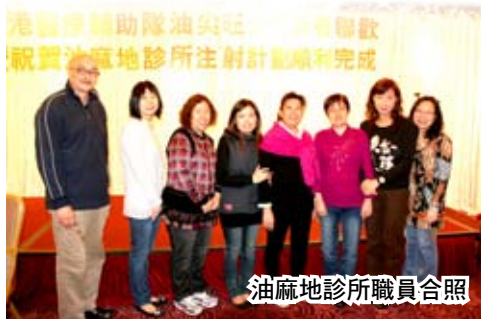
油麻地診所職員合照

晚宴是以上下同樂、簡簡單單、熱熱鬧鬧的晚宴形式進行，在酒酣耳熱之際，刺激遊戲及瘋狂大抽獎後，令在場各人盡興而返！