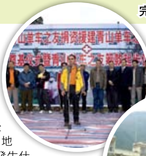
完成艱辛的旅程後，各籌款組員出席桐梓山區醫院奠基儀式

曾聽見有人說過『香港人情比紙薄！』，但實情是香港人外冷內熱，『一方有難，八方支援！』才是我們香港人的寫照。