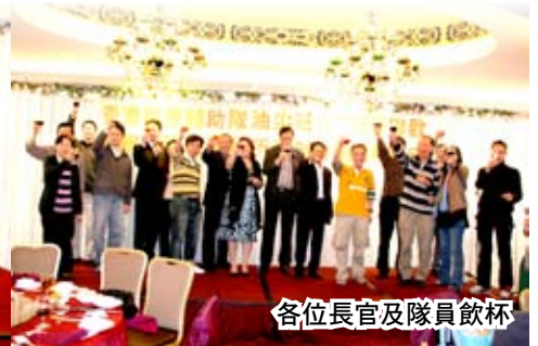
各位長官及隊員飲杯