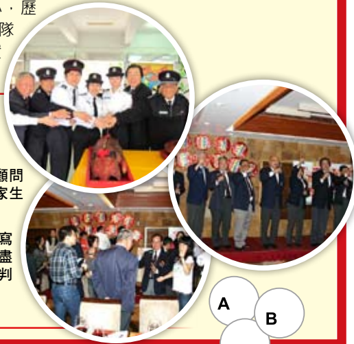
A B C