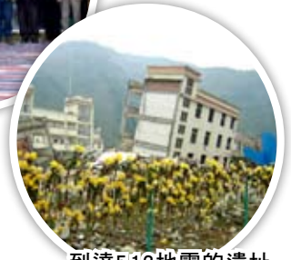
到達5.12地震的遺址為死難者默哀