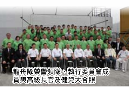
龍舟隊榮譽領隊、執行委員會成員與高級長官及健兒大合照