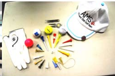
高爾夫球 - 部份裝備