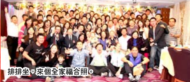
排排坐，來個全家福合照。