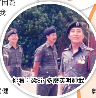
你看：梁Sir多麼英明神武