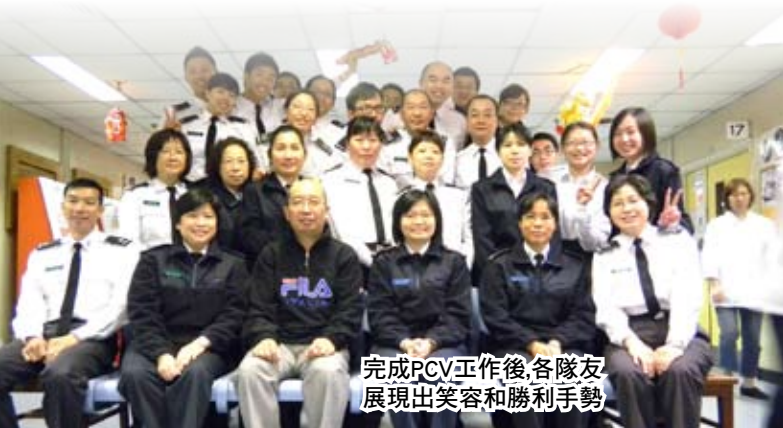
完成PCV工作後，各隊友展現出笑容和勝利手勢