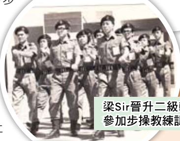
梁Sir晉升二級輔助男護士，參加步操教練訓練課程