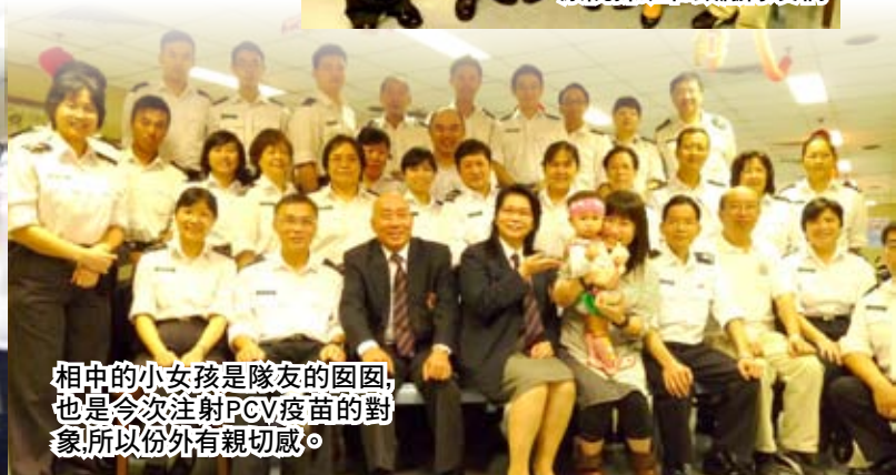
相中的小女孩是隊友的囡囡，也是今次注射PCV疫苗的對象，所以份外有親切感。