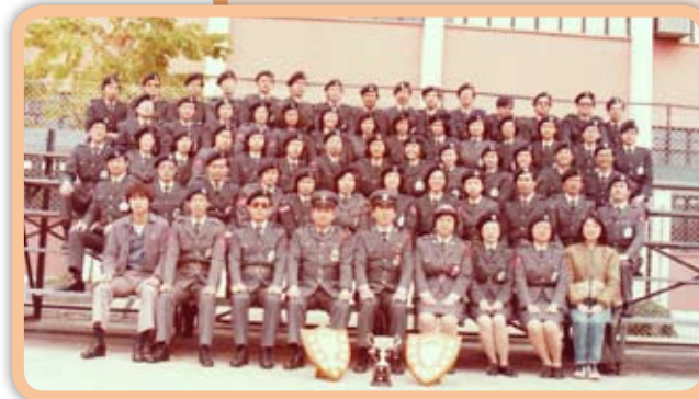
當年梁 Sir 帶領屯門隊勇奪比賽獎項

梁Sir及眾來賓要來個大合照；拍照後，梁Sir更請大家勿動，獨站出眾人前，以長達十五秒的九十度鞠躬道謝。