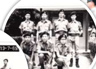
1968年梁Sir加入醫療輔助隊為一級輔助男護士