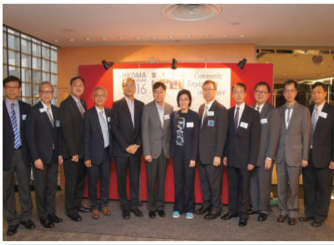
食物及衛生局局長高永文醫生, BBS, JP及總監陳漢儀醫生, JP與嘉賓合照