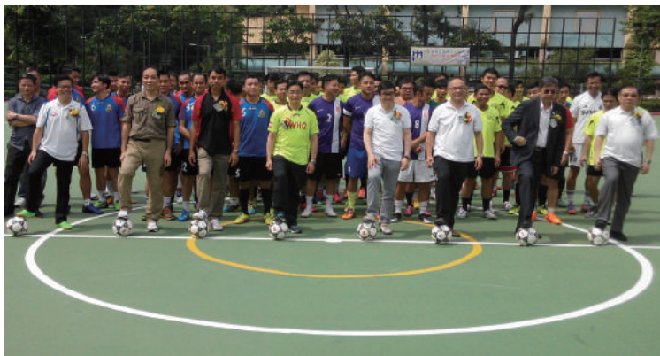
眾嘉賓主持開球禮