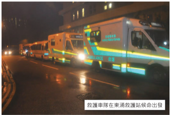
救護車隊在東涌救護站候命出發

2016年10月18日零晨時分，各參與隊員往總部集合，首先聆聽演習流程，接著各組領取物資前往東涌救護站候命。在演習時各隊員盡顯醫療輔助隊精神，各人全力以赴，與各部門通力合作成功，完成各項職務。