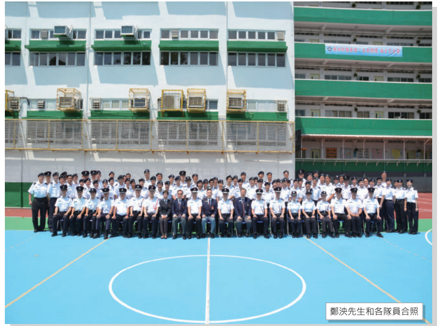
鄭決先生和各隊員合照