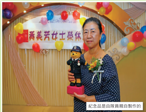
紀念品是由隊員親自製作的