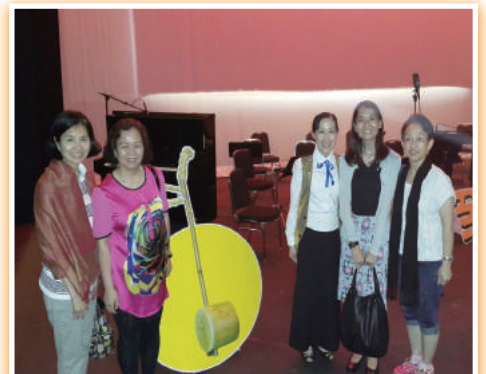
非常感恩，隊友也享受音樂所帶來的喜悅