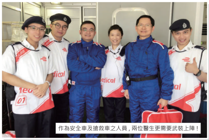
作為安全車及搶救車之人員，兩位醫生更需要武裝上陣！