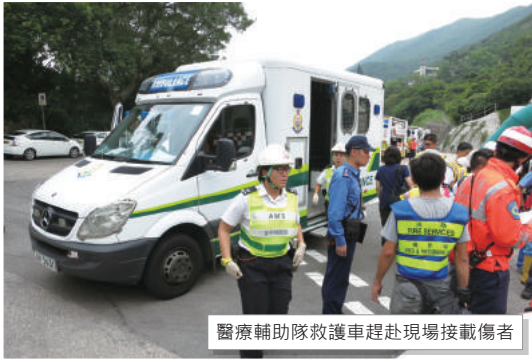
醫療輔助隊救護車趕赴現場接載傷者

2016年9月28日早上10時30分，大浪灣山邊發生山火並蔓延至大浪灣海灘，30名行山人士被山火圍困，有多名傷者及懷疑有行山人士在大浪亭附近墮崖。消防處發出山嶺搜救及山火呼喚。醫療輔助隊收到指示並迅速派出隊員於短時間內到達現場報到，及即時按照消防處要求加以配合並展開救援工作，協助分流及運送傷者往醫院。