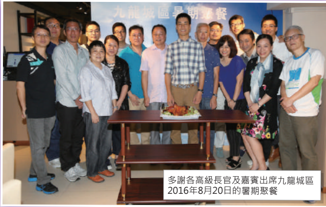
多謝各高級長官及嘉賓出席九龍城區 2016年8月20日的暑期聚餐

另外，吃喝玩樂讓大家輕鬆聚首一堂，暑期聚餐是大家最期待的活動之一。今次聚餐特別揀選一間社企餐廳以自助餐形式舉行，當中加插遊戲和抽獎，讓每一位到來的嘉賓、長官及隊友都盡興而歸。