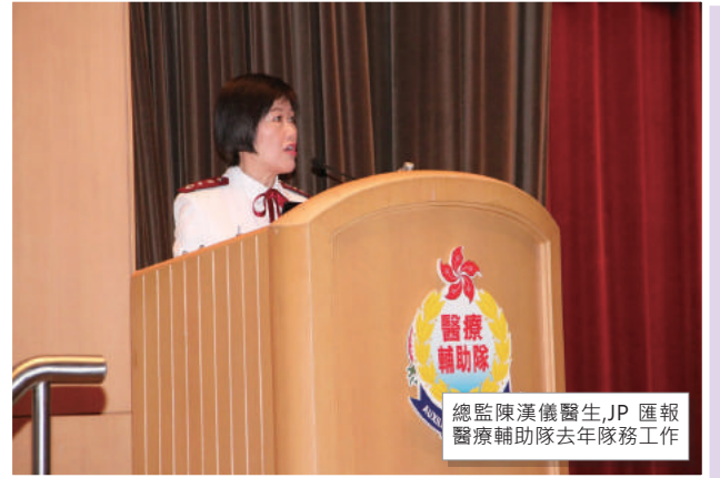
總監陳漢儀醫生,JP 匯報醫療輔助隊去年隊務工作