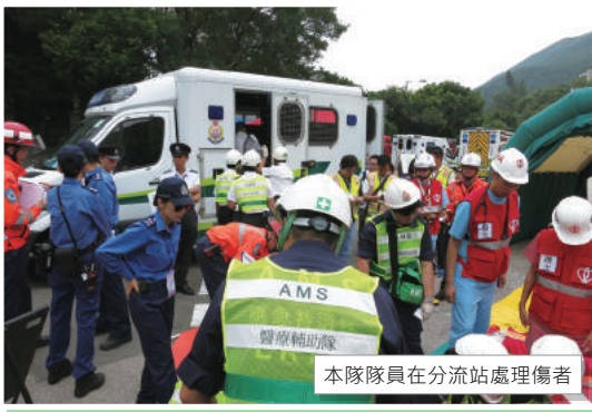
本隊隊員在分流站處理傷者

以上是2016年度跨部門山火及攀山拯救演練，多個部門共210名人員參與。演習目的旨在測試及加強各政府部門在應對山火及攀山拯救行動的協調、溝通、指揮與控制能力的效率和合作性。