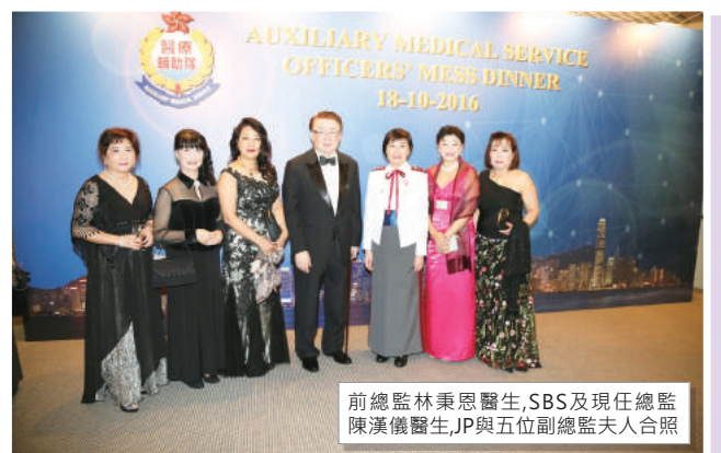
前總監林秉恩醫生,SBS及現任總監陳漢儀醫生,JP與五位副總監夫人合照