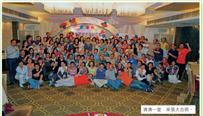
濟濟一堂，來張大合照。