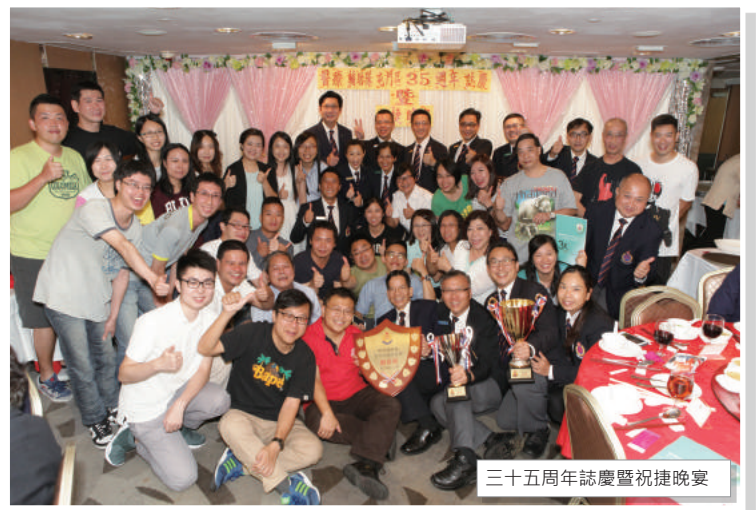
三十五周年誌慶暨祝捷晚宴