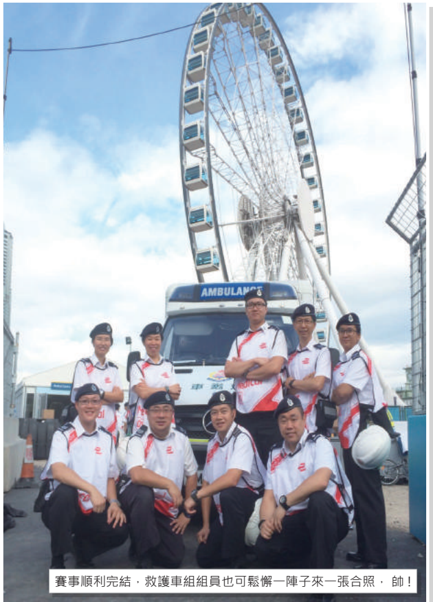
賽事順利完結，救護車組組員也可鬆懈一陣子來一張合照，帥！

兩天的值勤，無論對醫療輔助隊或各值勤人員都相信是一個挑戰，心情真是「戰戰兢兢，如履薄冰」，各隊員在任何時刻都處於高度警覺的狀態！幸好賽事期間並沒有任何嚴重事故發生，所有賽事也完滿結束。