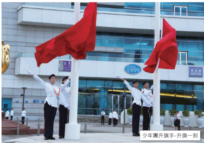
少年團升旗手-升旗一刻