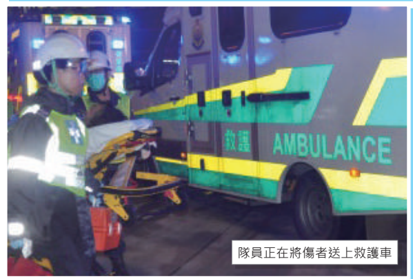
隊員正在將傷者送上救護車