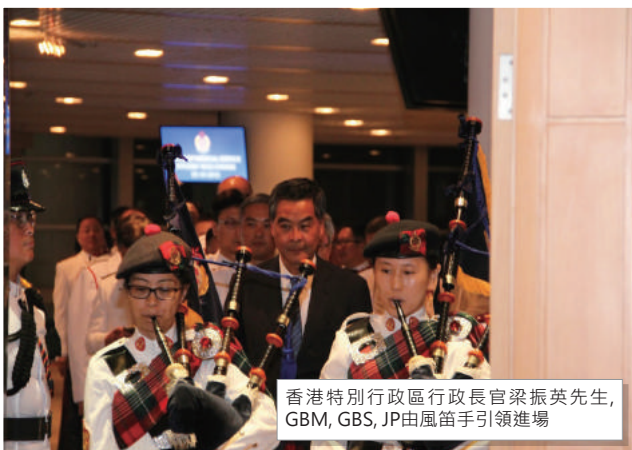
香港特別行政區行政長官梁振英先生,GBM,GBS,JP由風笛手引領進場