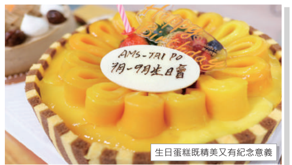
生日蛋糕既精美又有紀念意義