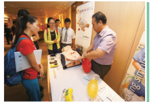
示範如何操作SimMan作訓練