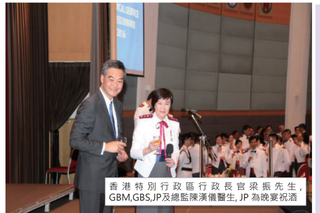
香港特別行政區行政長官梁振英先生,GBM,GBS,JP及總監陳漢儀醫生,JP為晚宴祝酒