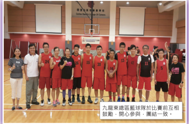
九龍東總區籃球隊於比賽前互相 鼓勵，開心參與，團結一致。