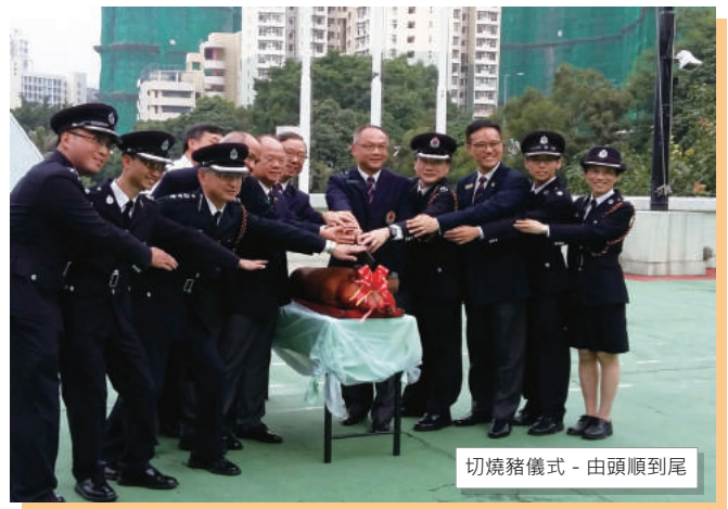
切燒豬儀式 - 由頭順到尾