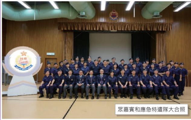
眾嘉賓和應急特遣隊大合照