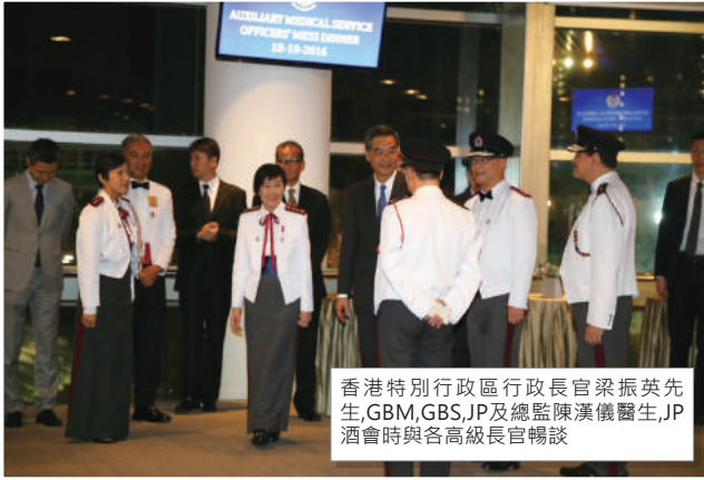
香港特別行政區行政長官梁振英先生,GBM,GBS,JP及總監陳漢儀醫生,JP酒會時與各高級長官暢談

醫療輔助隊周年晚宴已於十月十八日舉行，當日榮幸邀請到香港特別行政區行政長官梁振英先生,GBM,GBS,JP蒞臨主禮，令晚宴生色不少。