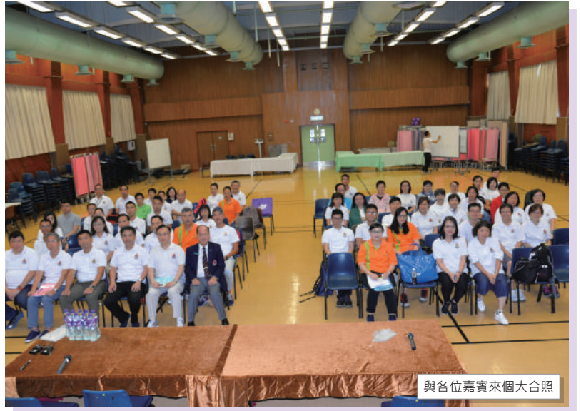
與各位嘉賓來個大合照