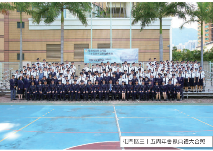
屯門區三十五周年會操典禮大合照