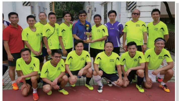
踢出風采捧盃而回