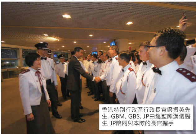
香港特別行政區行政長官梁振英先生,GBM,GBS,JP由總監陳漢儀醫生,JP陪同與本隊的長官握手