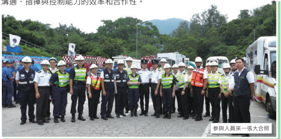
參與人員來一張大合照