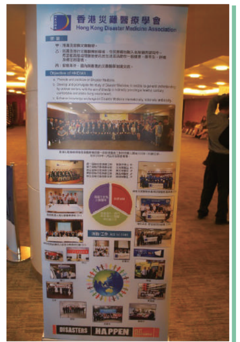
香港災難醫療學會簡介展板