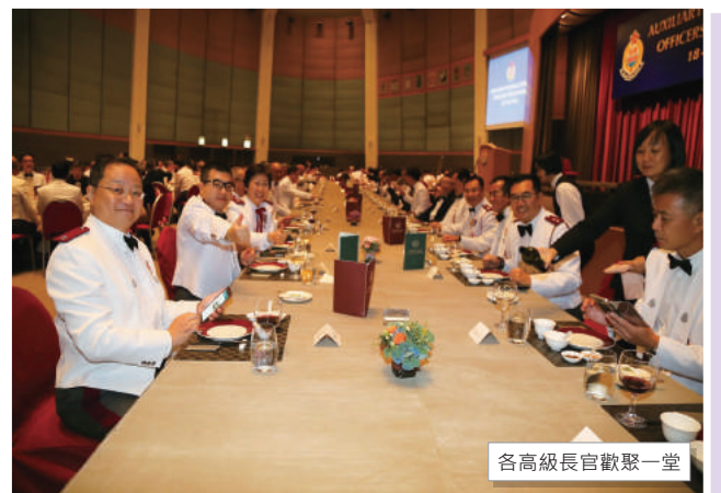
各高級長官歡聚一堂