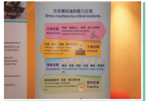
危急事故後的壓力反應展板

撰文：黃歡華（大埔區）