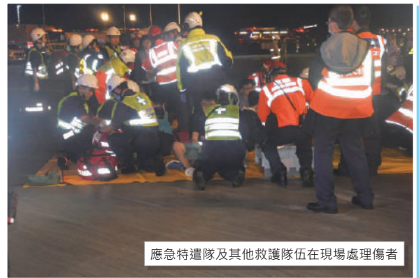
應急特遣隊及其他救護隊伍在現場處理傷者