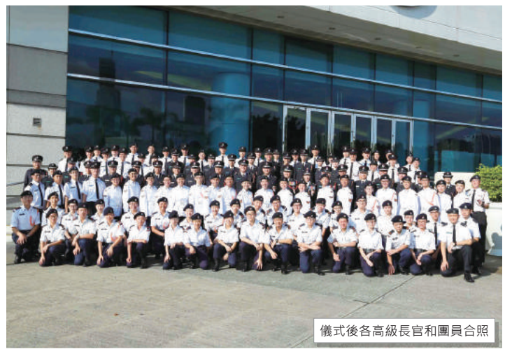
儀式後各高級長官和團員合照