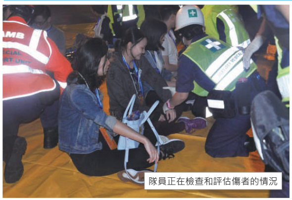
隊員正在檢查和評估傷者的情況