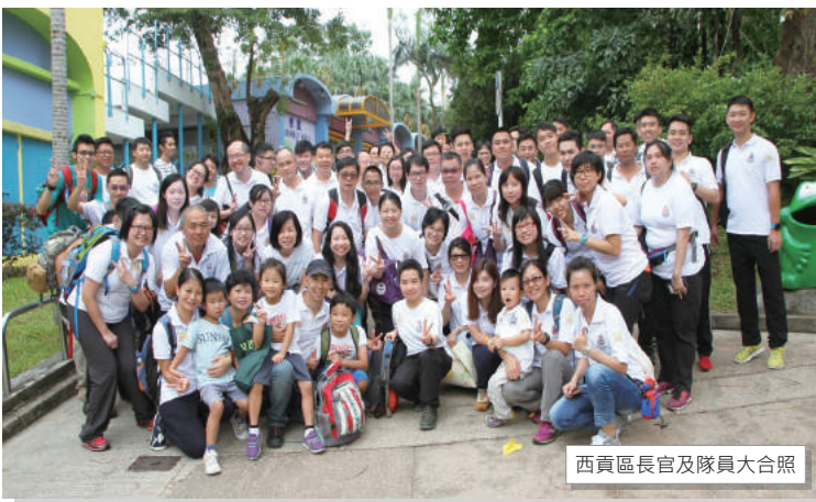
西貢區長官及隊員大合照

訓練日活動下午二時結束，期望下次再有機會舉辦戶外訓練活動，透過活動促使各長官及隊員一同群策群力發揮團結精神！