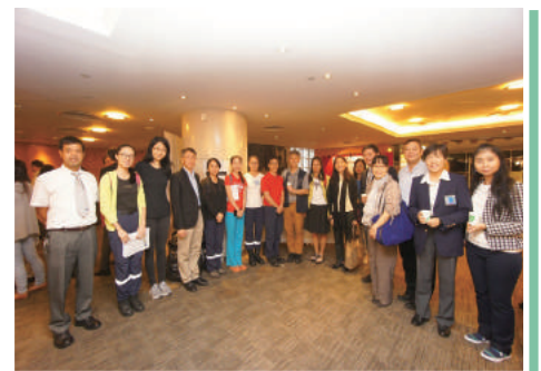
部分出席隊友合照